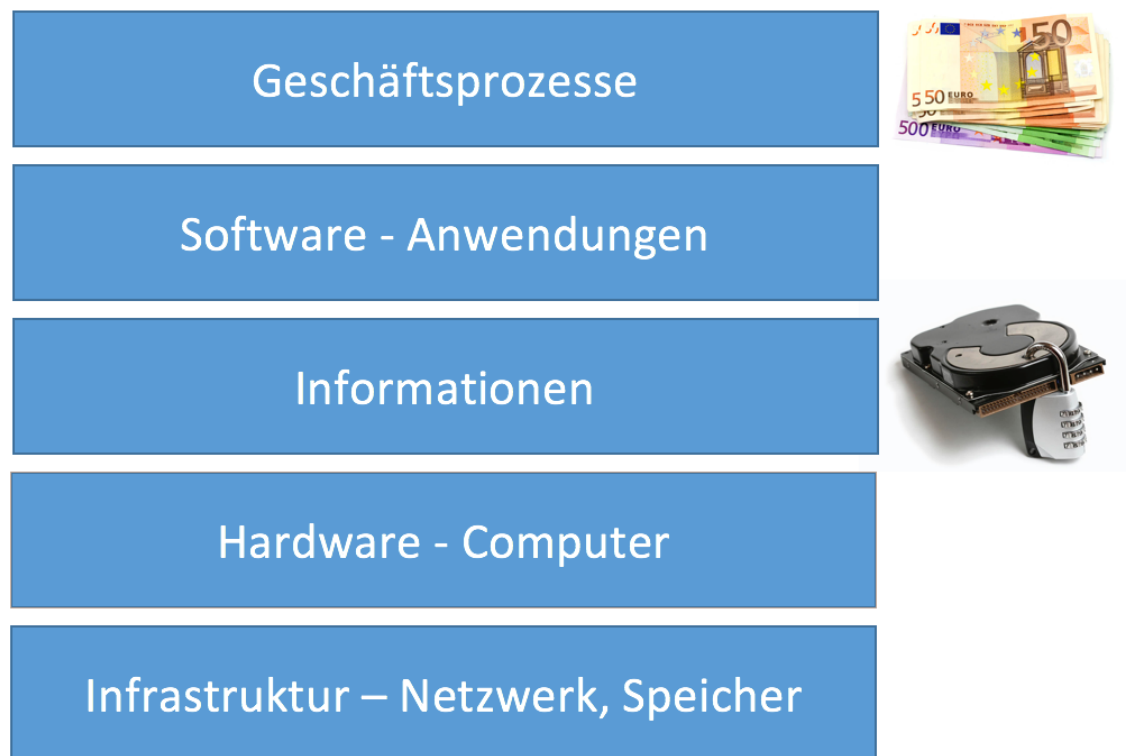
Abbildung 1: Information im Kontext